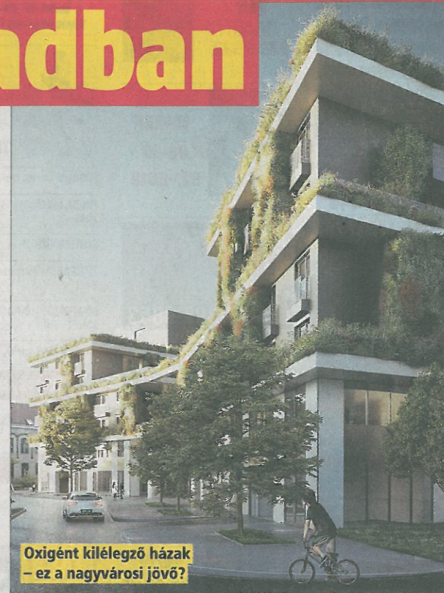
Oxigént kielégző házak – ez a nagyvárosi jövő?

– A 600 lakás mellett mintegy 2500 négyzetméter kereskedelmi területet is kialakítunk, illetve a házak között az autóforgalomtól elzárt, városi sétalótér lesz. Hosszabb távon az épületek összekapcsolják a felújított Szent István teret egy gyalogos felüljáróval és a majdan kiépülő Duna-parttal – tette hozzá az igazgató. H. Z.